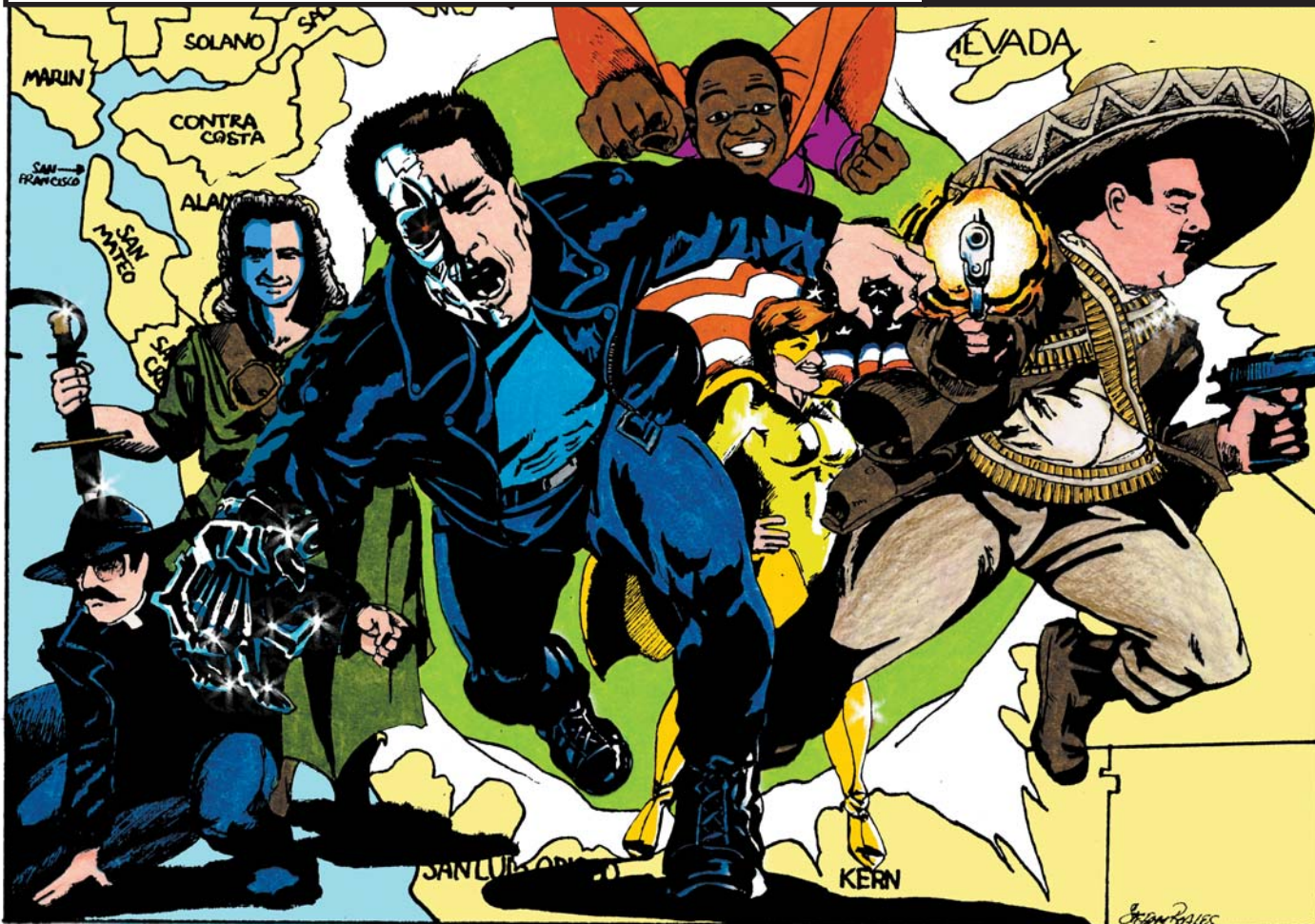
Ilustrado por / Illustration by Stefan T. Boales © La Voz 2003

¡Vienen por su voto! Cerca de 2 millones de firmas; ¿acaso esto es de personas insurrectas o simplemente incorrectas? They're coming for your vote! Nearly two million signatures; is it the people's revolt or just plain revolting?