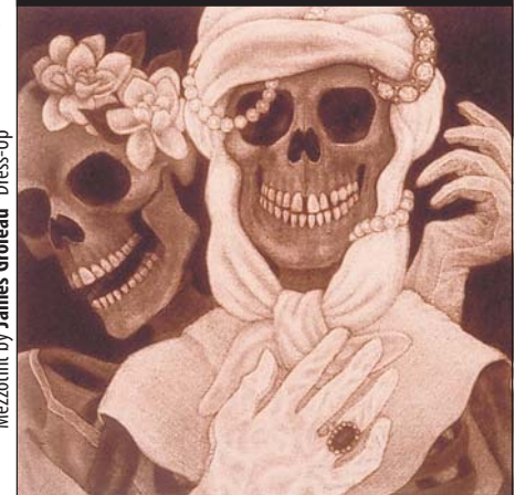
Mezzotint by James Groleau "Dress-Up"

Support La Voz! Become a Sponsor, Subscribe, Advertise – Help us to succeed!