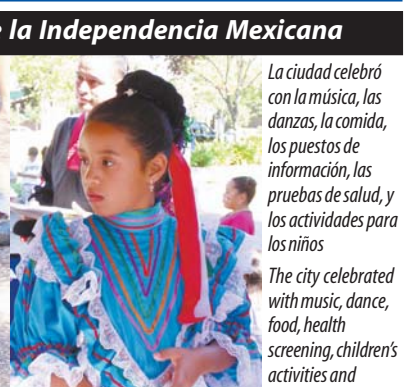
THE CITY OF SANTA ROSA CELEBRATED MEXICAN INDEPENDENCE DAY • Photo: ANI W. MORSE • see page 18