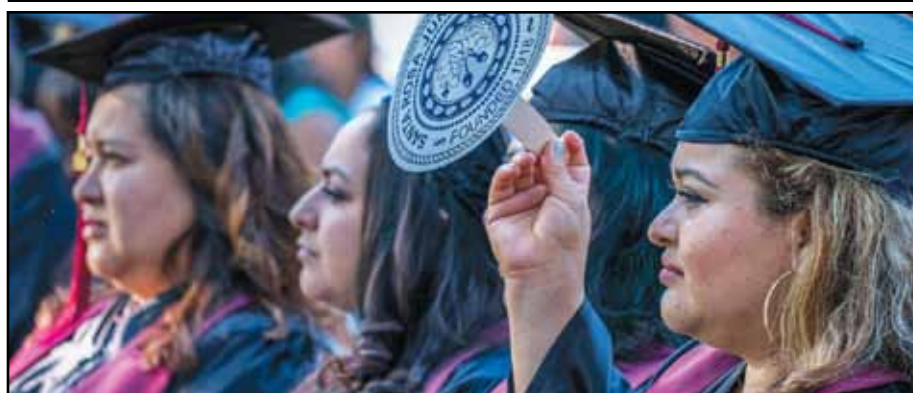
SRJC HEP GRADUATION IN LA VOZ PHOTO GALLERY WWW.LAVOZ.US.COM • ARE YOU THERE?