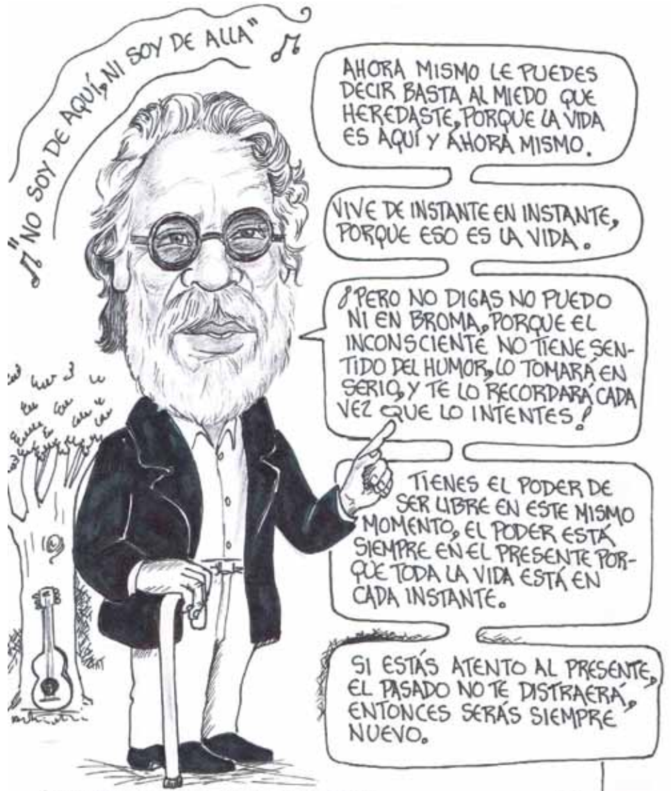
FACUNDO CABRAL (1937-2011) CANTANTE, COMPOSITOR, ESCRITOR, POETA Y DIBUJANTE ARGENTINO. FUE ASESINADO POR LA INCONSCIENCIA.