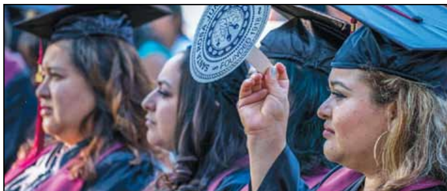
SRJC HEP GRADUATION IN LA VOZ PHOTO GALLERY WWW.LAVOZ.US.COM • ARE YOU THERE?

Current jobs with the SANTA ROSA CITY SCHOOL DISTRICT are now posted on the front page of www.lavoz.us.com and on the La Voz social media network: La Voz Bilingual Newspaper Facebook page and the La Voz Bilingual Newspaper Fans Facebook group . Or visit https://www.edjoin.org and search “Santa Rosa City Schools” for complete details and expiration dates as most jobs are “open until filled.” Take a look!